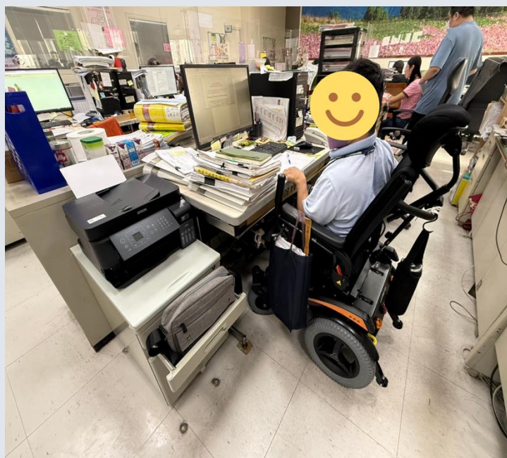
改善辦公桌及提供個人事務機

外，小樂的行動能力無法執行外勤工作。經由調整職務內容、改善工作設備及提供輔具，小樂正式成為公職新鮮人。